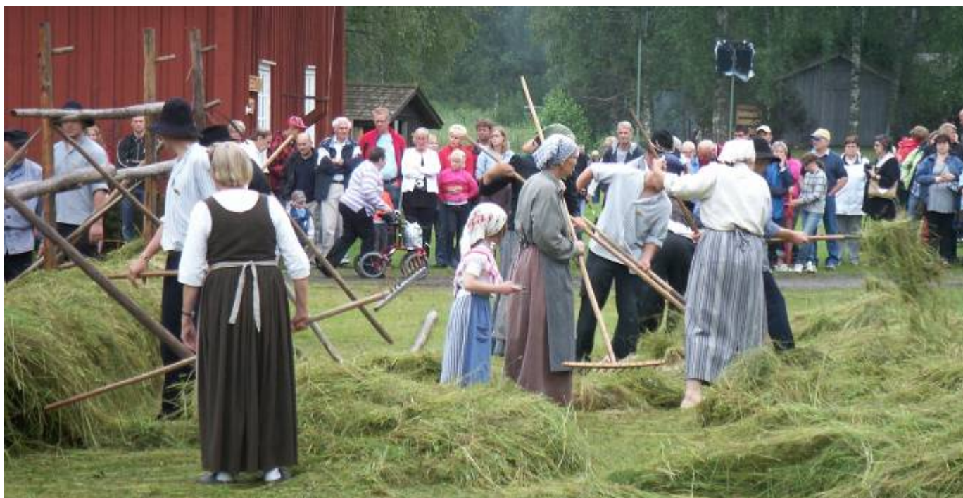
... hur både barn och vuxna deltar i arbetet med att hässja hö